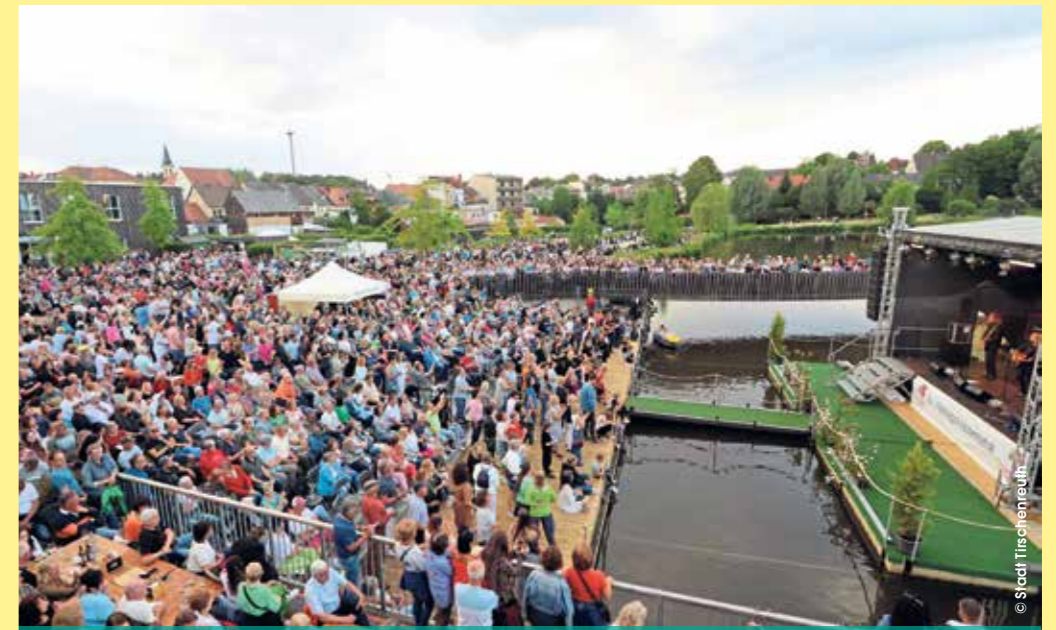
Ob tanzend vor der Bühne, picknickend auf der grünen Wiese oder chillend im Kanu auf dem Stadtteich: Über 4.000 Besucher feierten auf ihre Art am 17. Juni den Auftritt der Kultband „Münchener Freiheit“. An den vier KulturSommer-Wochenenden mit ihren zahlreichen Veranstaltungen wurden insgesamt über 30.000 Besucher gezählt.

ragende, in Wort und Bild gemachten Beiträge! • Beim Hotel & Restaurant Seenario für deren Bereitschaft, einen Monat lang die Geräuschkulisse sämtlicher Veranstaltungen in direkter Nachbarschaft miterleben. Aber auch für die Mitwirkung und Hilfe bei der Bewältigung des Besucheransturms!