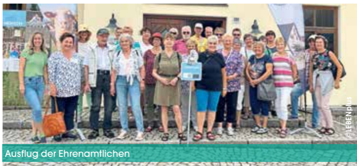
Ausflug der Ehrenamtlichen