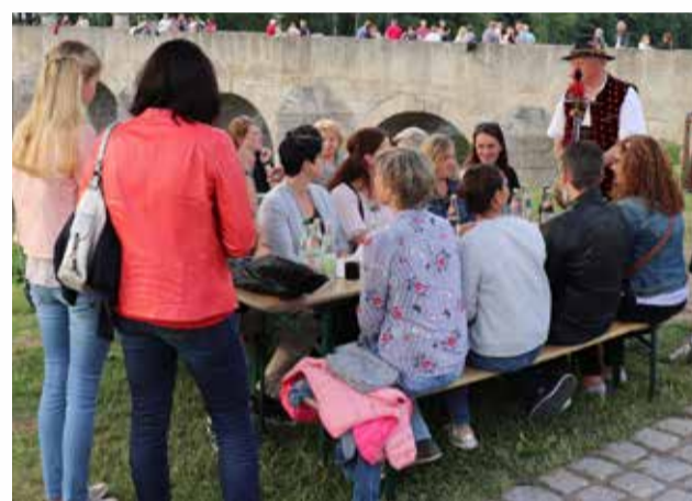
Impression vom FischhofSchoppen 2018.

Der Förderverein Fischhofpark lädt aber bereits am Vorabend der offiziellen Gartentage-Eröffnung zum Preopening-Event „FischhofSchoppen“ ein. Dazu heißt er am 24. Juni alle Stimmungs- und Genussliebhaber ab 18 Uhr herzlich auf der historischen Fischhofbrücke willkommen, die sich