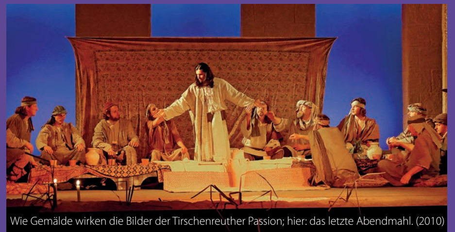
Wie Gemälde wirken die Bilder der Tirschenreuther Passion; hier: das letzte Abendmahl. (2010)

„Die Tirschenreuther Passion“ wird im nächsten Jahr insgesamt acht Mal gespielt. Neben der Premiere am 14. März noch am 15., 20., 21., 22, 27., 28. und 29. März, jeweils um 20 Uhr im Saal des Kultur- und Veranstaltungszentrums Kettelerhaus. Der Kartenvorverkauf startet am 1. Dezember bei der Tourist-Info und im Internet unter www.okticket.de . Da hat man auch gleich ein passendes Weihnachtsgeschenk!