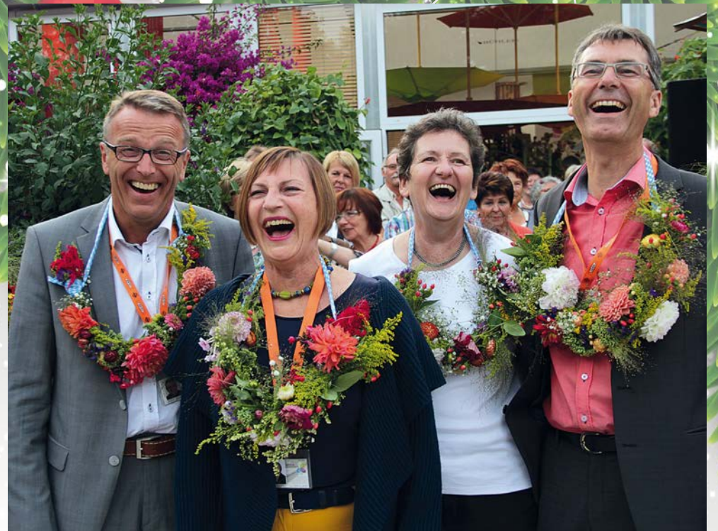
So können nur Sieger strahlen! Die Gartenschau „Natur in Tirschenreuth“ vom 29. Mai bis 25. August 2013 war ein toller Erfolg und verbuchte über 260.000 Besucher.

Tirschenreuth mit seinen zahlreichen Bildungs- und Sozialeinrichtungen, die Entwicklungsmöglichkeiten fördern und generationsübergreifendes