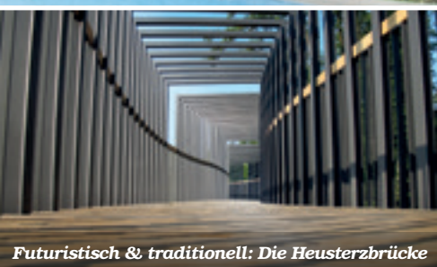
Futuristisch & traditionell: Die Heusterzbrücke