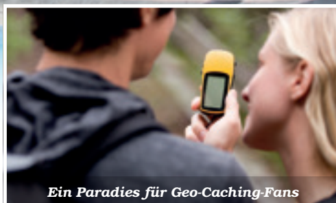
Ein Paradies für Geo-Caching-Fans