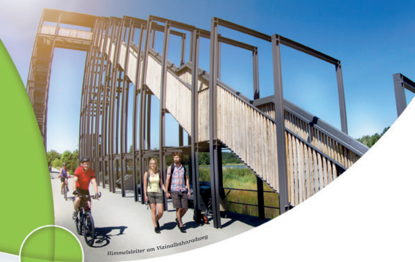
Himmelsleiter am Vizinalbahnradweg