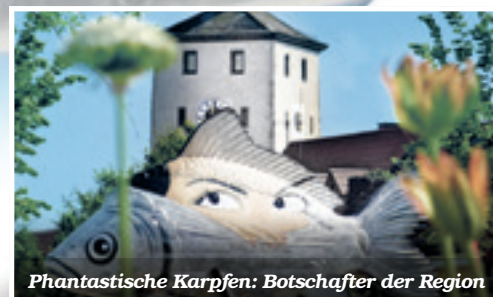
Phantastische Karpfen: Botschafter der Region