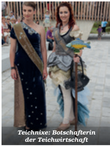
Teichnixe: Botschafterin der Teichwirtschaft

Tradition und Moderne begegnen sich in Tirschenreuth hautnah. Sie zaubern sowohl einen harmonischen Einklang als auch spannende Gegensätze und prägen damit das unverwechselbare Gesicht unserer Stadt und unserer Region.