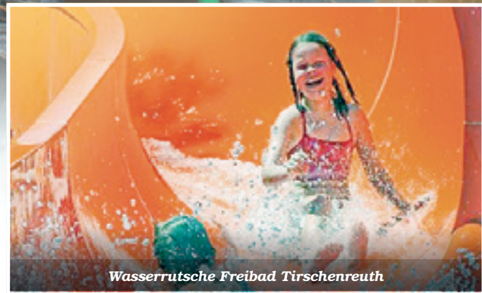
Wasserrutsche Freibad Tirschenreuth