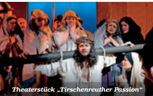
Theaterstück „Tirschenreuther Passion“